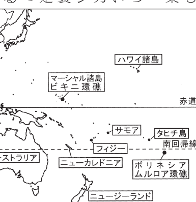
フランスも1966年からムルロア環礁で核実験を行った

監督の『君たちはどう生きるか』、視覚効果賞に山崎貴監督の『ゴジラー1.0(マイナスイオン)』とついでに、『日本映画2作品がダブル受賞』したことで、これには何か因縁めいたものを感じる。