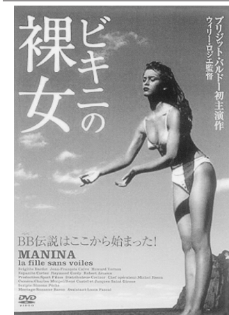
17才のバルドーが主演に抜擢された「ビキニの裸女」

で、通算30作目ともなる大ヒット特撮怪獣映画シリーズとなってきた。一方、同じ「核実験」から着想を得たのが、水着の「ビキニ」だった。米国は、早くも終戦の翌年の1946年(昭和21年)から、ビキニ環礁での核実験を開始したが、1954年(昭和29年)3月1日に始めた新たな水素爆弾は、広島型原爆の一千倍の威力を持ち、爆心地から160キロも離れた操業していた第五