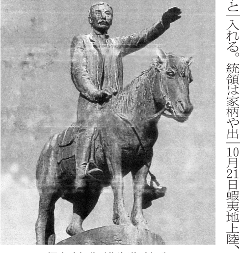
榎本武揚像 (北海道・対雁)

めて駿府に70万石を与え、石高を10分の1に減封された徳川家には最早5千人（家族を加えると2万人超）の家臣を養うことが望めない。今や賊軍として官軍に追討される身となった榎本は、未だ開発の手が及んでいない蝦夷地に新しい国を作ろうと考