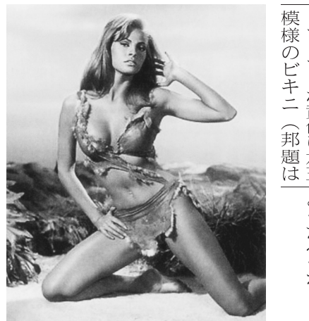
衝撃を与えたラクエル・ウェルチのビキニ姿

今日では想像もできないが、イタリアやスペイン等のカトリック教国では、法律で禁止されるほどで、これが許容されたのは、1952年(昭和27年)制作の「ビキニの裸女」で、フランスのセックスシンボルであったブリジット・バルドーが