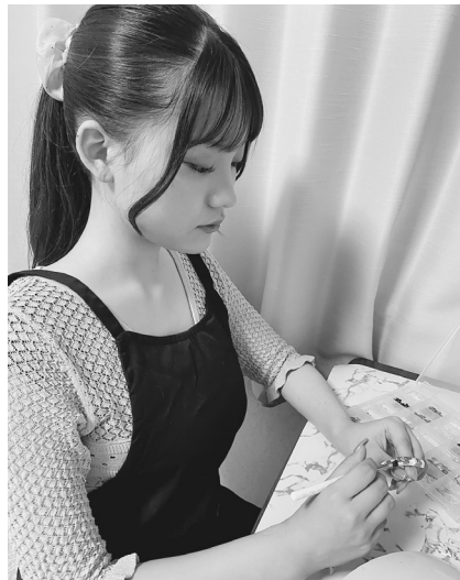
中学生からはじめた趣味のネイルアート

伊東市出身で、地元の商業高校卒業後、三島信用金庫に入庫。身近に銀行員がおり、幼い頃から業務に関心を持っていた点や、商業高校で学んだ意識を地元で生かしたいという思いから入庫を決めた。当初は伊東営業部でさまざまな業務に励んでい