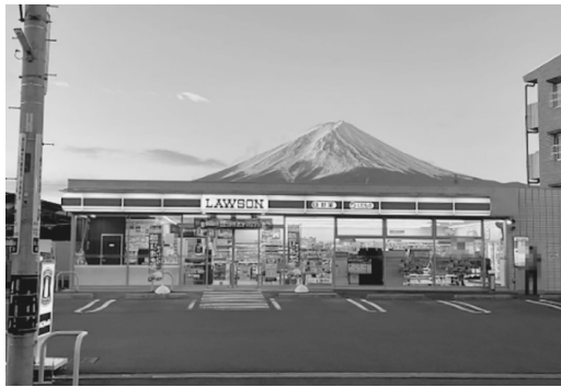
富士山とコンビニ

山梨県富士河口湖町では、晴れた日には富士山とコンビニを同時に望めるスポットとして多くの観光客が訪れ、道路への飛び出しなどが横行。対策として黒幕を設置したところ、その黒幕にも穴が10個以上開けられてしまった。 また同じく、空に向かって続くように見える階段、「富士山夢の大橋」があるとして富士市が騒がれたしている。 観光客の急増は一見、経済的な好機に思えるが、長期的には施設の混雑による経済損失が生ずることがある。 「何人の観光客が来た」という数ではなく、「どういった人に来てもらうか」という質を重視して、お互い、尊敬される旅人になろう。 他人事ではない。温泉地を多く有する我々の伊豆半島では、いずれ、訪日観光客とのマナー問題が、間違いない持ち上がる時期が来るだろう。入浴、入湯前のマナー、着衣の有無、盗撮などなど、日本旅館の経営者の悩みは、まだまだ尽きない。