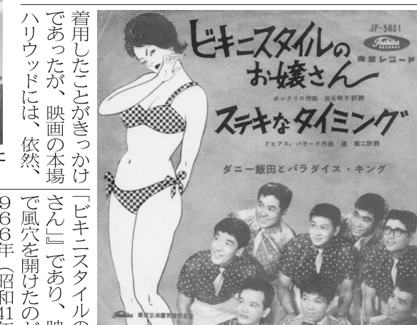
和訳ですぐに歌われた「ビキニスタイルのお嬢さん」

で、通算30作目ともなる大ヒット特撮怪獣映画シリーズとなってきた。一方、同じ「核実験」から着想を得たのが、水着の「ビキニ」だった。米国は、早くも終戦の翌年の1946年(昭和21年)から、ビキニ環礁での核実験を開始したが、1954年(昭和29年)3月1日に始めた新たな水素爆弾は、広島型原爆の一千倍の威力を持ち、爆心地から160キロも離れた操業していた第五