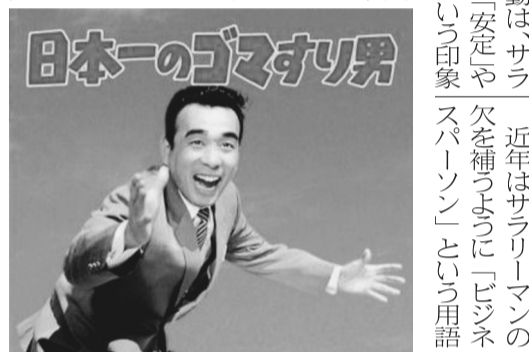
一世を風靡した植木等のサラリーマン映画

平安美人は眉毛が無く口紅もつけないノッペラボウであった。「匂うがごとき花の顔」などと言った時の「匂う」とは、輝くような白さを讃える言葉なのである。白さの根源の「おしろい」は、上等のものは水銀、下等のものには亜鉛を