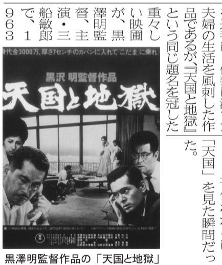
黒澤明監督作品の「天国と地獄」