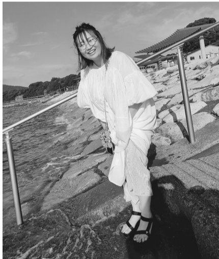
らららサンビーチ (沼津市) にて

東京での仕事を退職後に心機一転、2022年6月半ばに函南町に移住。地縁はなかったが、同町に在住している友人夫婦を頼った。たまた