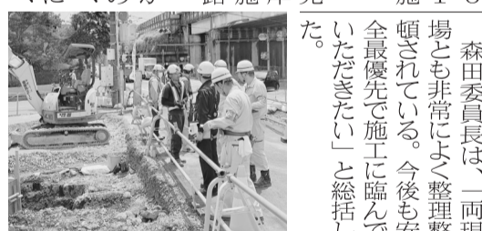
貴族たちと語らう紫式部「紫式部日記絵詞」より

平安貴族たちは、栄養不足や不健康な環境の中で、平安京の夏の猛暑と冬の極寒に耐えながら、ひたすら公務と詩歌管弦に励み、その太く短い生涯を送ったのである。