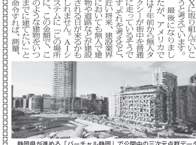
静岡県が進める「バーチャル静岡」で公開中の三次元点群データ

「X(デジタルでビジネス改革)の掛け声のもと、社会全体で生産性向上を目指しています。建設業界においても、BIM(3Dモデル情報)による企画・設計、ドローンによる三次元測量、自動制御機械による施工、映像通信による遠隔現場検査などの先端技術を活用した取り組みが行われています。一方、これらシステムの導入には、相応の資金や人材が必要になるため、全体としてみれば思ったほど活用が進んでおらず、より一層、業界内における横の連携や国・県・市町村からの支援などが求められているのではないかと感じています。 こうした中、私もできることから始めようと考えています。建設現場の検査員や、当分の遠隔現場は計測などを主とする中間検査のみとするので対応していただきます。これからのXを取り組んでいくことを考えています。 最後に、アメリカでは7年前から無人タクシーが街中で普通に走っているそうです。それを考えると、近い将来、建設業界においても無人で建物や道路などが建設される日が来るかもしれません。AIシステムに「この場所、この金額で、このような建物をいつまでに建てたい」と