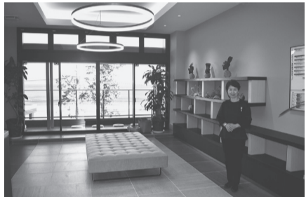
美しい料理とこだわりの露天風呂でもてなす

出身は神奈川県で、東京で別の仕事をしていたが、結婚を機に夫婦で脱サラを決心。旦那さんの両親が住む熱海市で、民宿を始めた。「最初は自分たち夫婦とアルバイトだけで成り立つ民宿を営んでいた」と当時を振り返る。その後、現在の宿が立つ土地を買い取り旅館の経営を始め、2024年7月には新館をオープンした。「今の宿は、熱海海が