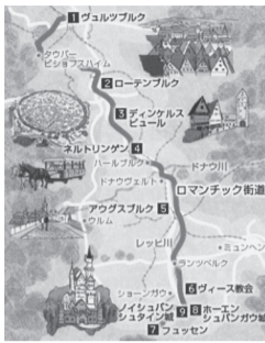
ローマンチック街道 (阪急交通社)

後、はるかに遠いローマに向けて、カンリックの信徒たちが宮々と整備した「巡礼の道」といふ部(今)を帝国内に拡大するのに伴って延長された「ローマ街道」は、紀元前118年に、前執政官のドミティウス・アヘノバルブスが、この地方を征服して属州化すると共に、ヒスパニア(現在のイベリア半島)へかけて続く主要なローマ街道として建設したもので、ドミティウスに因んで付けられたものであった。故に、「ドミティア街道」沿いには、今でもあちこちにローマの遺跡が残されているが、「フランスの中のローマ」と呼ばれるのが「ドミティア街道」の東西を眺め、北への交通の要衝として築かれた「ニーム」だ。そのニームは、はるか遠く離れた「ローマンチック街道」のアウグストゥスと同様、ローマ皇帝アウグストゥスによって、泉の精ネマウスにちなみ、「ニコニア(植民地)・ネマウス(ニーム)・アウグスタ」と命名され、ガリアのもっとも富裕な町に繁栄していった。