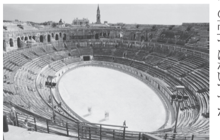
円形闘技場 (ニーム)

美しい料理とこだわりの露天風呂でもてなす。現在の、闘牛やコンサートに使用されている「円形闘技場」や、「メゾン・カレ(神殿)」などの数々の遺跡には、往時のローマの強大な力を思い知らされるが、世界遺産の水道橋「ポン・デュ・ガール」を